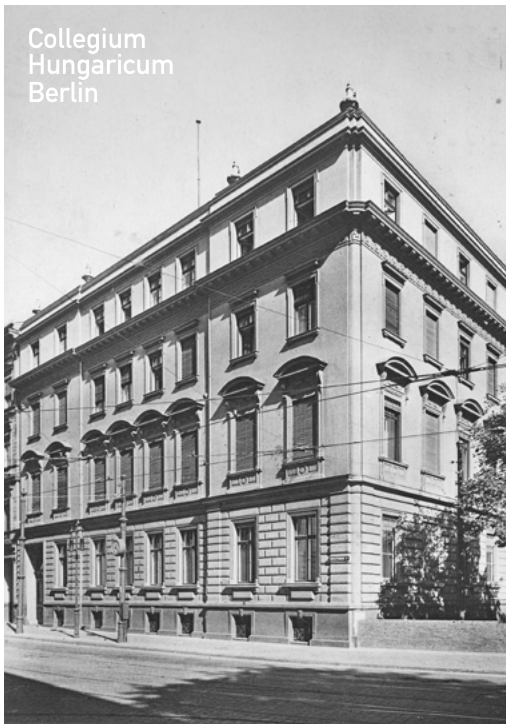
Collegium Hungaricum Berlin