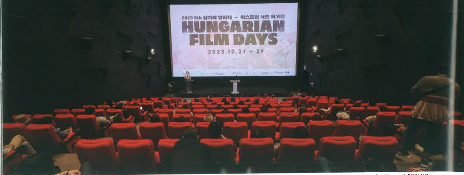
Rubik's Cube