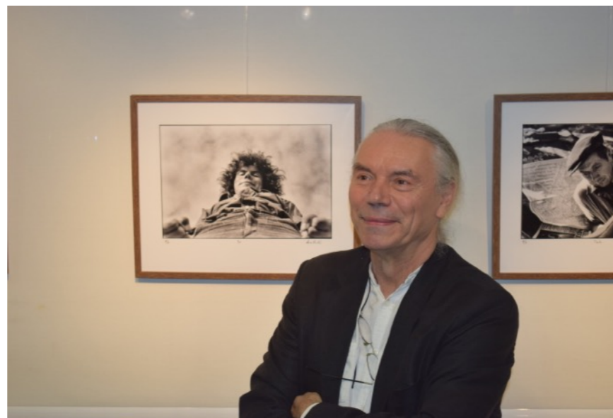
Kertész, André [Andor Kertész]