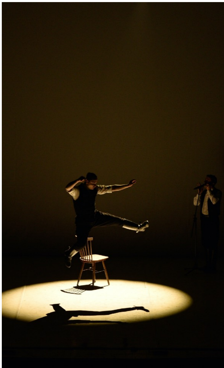
A Magyar Állami Népi Együttes Bosznia-Hercegovinában.

A Nyugat-Balkáni Magyar Kulturális Évad megszervezéséről Magyarország kormányának 1176/2018. (III. 28.) számú kormányhatározata döntött. A régió hat országában – Szerbiában, Bosznia Hercegovinában, Észak-Macedóniában, Montenegróban, Koszovóban és Albániában – 2018 őszétől 2019 decemberéig zajlottak kulturális programok.