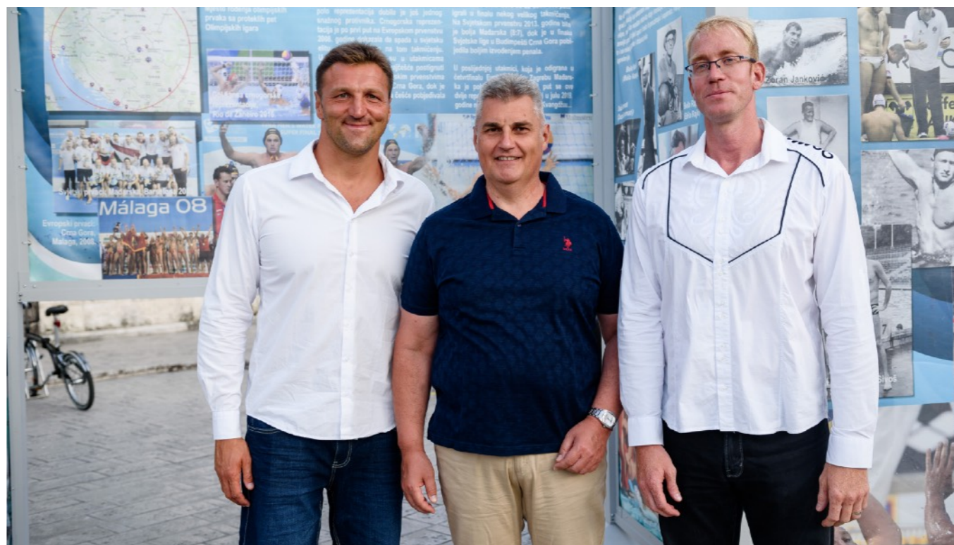
Kiss Gergely háromszoros olimpiai bajnok, vízilabdázó és Steinmetz Ádám olimpiai bajnok, vízilabdázó a kiállítás megnyitóján, Kotorban.

A megnyitók iránt a sportág helyi képviselői mellett nagy számban érdeklődtek azok a sportszerető helybéliek is, akik a medencék partján vagy a képernyők előtt ülve támogatják kedvenc csapataikat. A szabad tér és a tengerparti sétányok igazodtak a tengermelléki vízilabdázás körülményeihez, hiszen ezekben az országokban még ma is a tengerben úszik ezt a sportot.