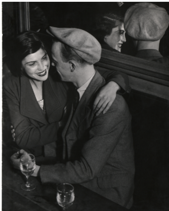
Brassai [Gyula Halász]: Párizsi pár a „Quatre-Saisons” táncsteremben (rue de Lappe), 1932

A Nyugat-Balkán számos fővárosi és vidéki helyszínén került kiállításra a Budapesti mesék című fotókiállítás, köztük Szerbiában, Bosznia-Hercegovinában, Észak-Macedóniában, Montenegróban és Albániában.